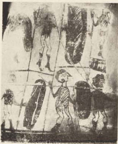
Fragments de vasos d'Oliva.