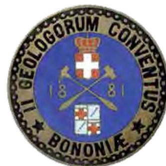
Figura 5. Insignia del II Congrés Geològic Internacional (Bolonya, 1881) / Insignia del II Congreso Geológico Internacional (Bologna, 1881) MPV

de l'Associació Americana per a l'Avanç de la Ciència. D'aquesta manera, el Primer Congrés Geològic Internacional es va celebrar a París, el 1878; a ell va assistir Vilanova, qui va assumir, com era en el costum, un paper molt actiu. A més de la nomenclatura, una altra de les línies bàsiques per a l'estandarització de la comunicació geològica afectava els mapes; era necessari crear un codi visual que facilitara una interpretació universal de les representacions cartogràfiques. Des del congrés de París, aquesta va ser una altra de les línies prioritàries de treball, que van continuar en els congressos successius. Al Segon, que es va celebrar a Bolonya [figures 4 i 5] tres anys després, va tornar a assistir el nostre personatge, en qualitat de vicepresident. Allí, Vilanova es va erigir en un dels més destacats