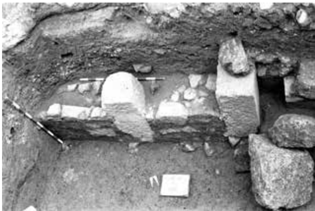
Mur de bona factura del interior del circ romà. Carrer de les Comèdies, València.

d'una casa islàmica dels segles XI al XIII, a l'oest de l'absis, impedeix que es conega millor.