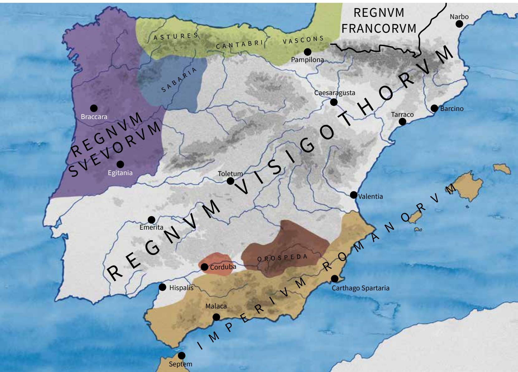
Mapa polític de la península Ibèrica a l'inici del regnat de Leovigild. Il·lustració: Espirelius.