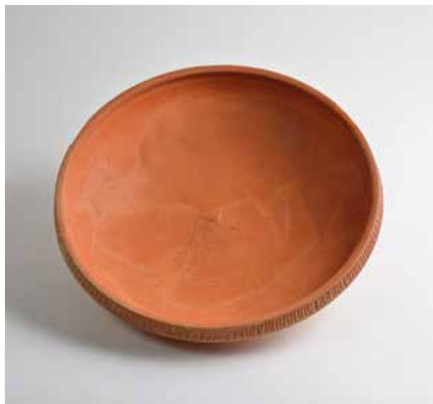
Bol de ceràmica de taula d'Àsia Menor. Plaça Nàpols i Sicília, núm. 10. València, SIAM-Ajuntament de València.

Entre el 778 i el 779, Valentia va ser destruïda en una guerra civil entre musulmans, moment que potser va marcar el final de la ciutat tardoantiga. No obstant això, l'arqueologia ha sigut molt parca per a aquests moments de transició, tant per al segle VIII com per al segle IX.