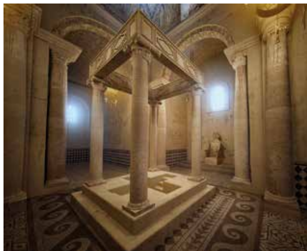
Reconstrucció de l'interior del baptisteri de Valentia. Arquitectura virtual. Ajuntament de València

La gran catedral va ser un magne edifici que degué ocupar la major part de l'actual plaça de l'Almoïna, amb