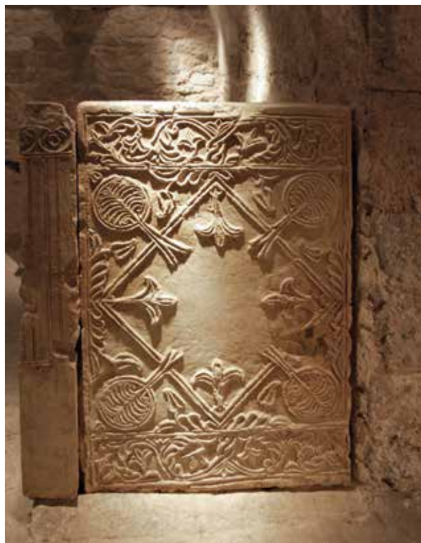
Cancel·l que devia estar a l'interior de la catedral de Valentia . Presó de Sant Vicent Màrtir. Ajuntament de València

A Hispània són escassos els referents de construccions semblants. Tan sols el cas de Barcelona, deu servir per completar alguns elements de què no disposem a València, com el palau episcopal i una gran aula de comunicació interna. Les troballes del probable grup episcopal d' Elo , a Hellín (Albacete), amb la seua basílica i el seu baptisteri són d'extraordinari interès, encara que pertanyen a una xicoteta ciutat fortificada, que va acollir una efímera seu episcopal.