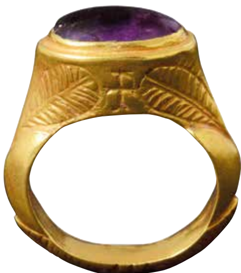
Anell d'or d'una tomba visigoda. Excavacions de l'Almoïna. Ajuntament de València

Un element important de l'urbanisme va ser l'antic circ, el llarg traçat del qual va fixar el límit oriental de la ciutat fins al segle XIV, i durant diversos segles va servir de muralla urbana. El seu ús original va cessar en el segle V i a partir de mitjan del segle VI el seu ampli espai interior va ser urbanitzat. Altres restes d'habitacions apareixen a l'oest del circ. Són extremadament modestes i solen compartir els espais amb fosses pròximes, que aconseguen una extensió i profunditat considerables, i que acaben sent omplides amb fems i immundícies quotidianes, entre les quals no falten cossos d'animals. Aquest tipus d'hàbitat urbà significa un canvi radical sobre la forma de vida de l'etapa romana. València, a partir del segle VI devia estar ocupada per una infinitat de xicotetes unitats familiars, que no sols devien servir de residència, sinó com