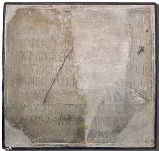
Inscripció commemorativa de la reforma d'un edifici religiós important (Catedral o baptisteri). Plaça de l'Almoïna. Museu de Belles Arts de València

El concili celebrat a València el 4 de desembre del 546 de l'era cristiana i 15 del regnat de Teudis, tanca una sèrie de