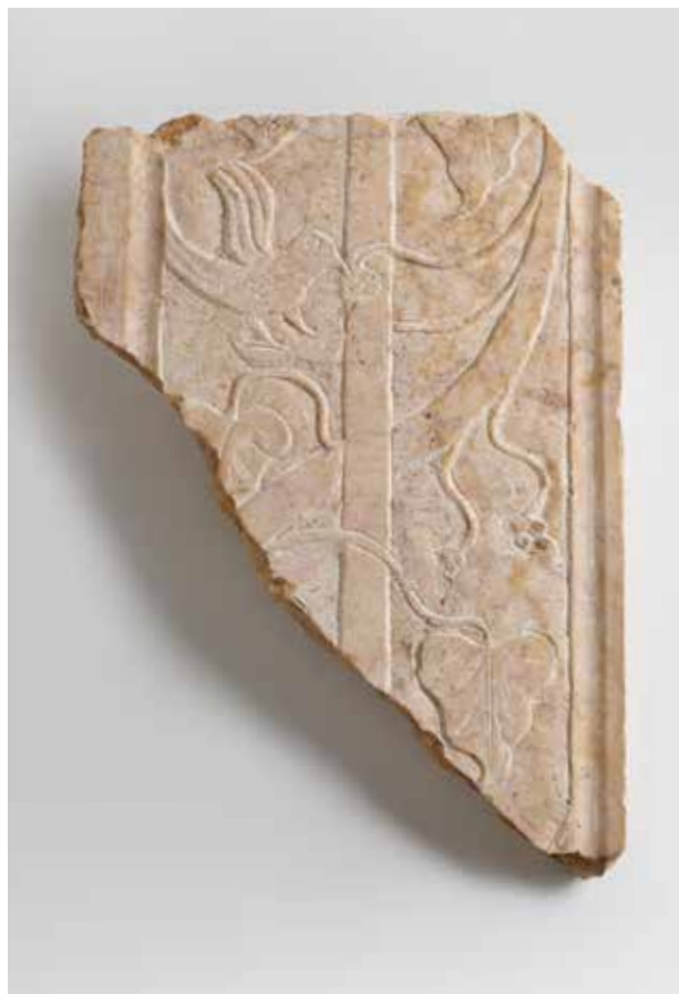
Placa de marbre de Buixcarró (Xàtiva) amb decoracions de simbologia cristiana procedent de l'Almoina.

Una prova indirecta de la persistència física, no d'ús, dels edificis públics romans, n'és el saqueig sistemàtic, que s'intensificà a partir del final del segle V o VI, quan van esdevenir la pedrera principal de la ciutat, en un moment de gran activitat constructiva.