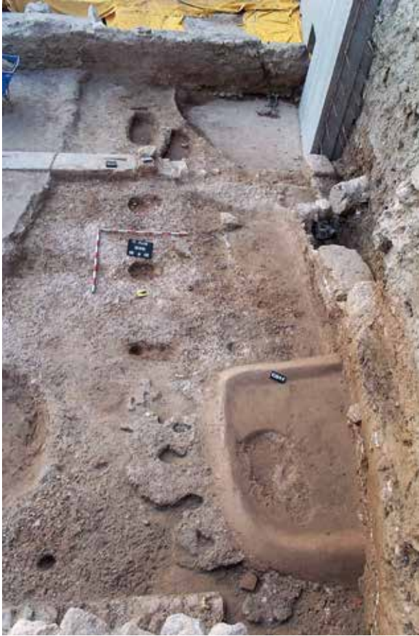
Edifici administratiu situat al sud de les excavacions de l'Almoína.

(africana C) i monedes (antoninià de Trebonianus Gallus ) de les trinxeres de fundació i els paviments.