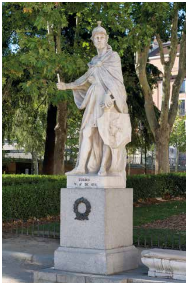
Francisco de Vogue. Euric, rei visigot (420-484) , 1750. Pedra calcària, 285 x 120 x 110 cm. Plaça d'Orient, Madrid.

La derrota de les tropes romanes locals i l'arribada de nous contingents bàrbars de més enllà del Danubi van provocar la intervenció directa de l'emperador Valente, que es trobava lluitant en la frontera persa. Al capdavant de l'elit de l'exèrcit d'Orient, l'any 378 Valente va ser derrotat i mort en la cèlebre batalla d' Adrianopolis , a Tràcia, prop de la mateixa Constantinoble. Aquesta