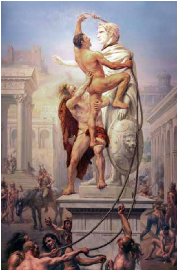
Joseph Noël Sylvestre. El saqueig de Rome el 410 pels Bàrbars , 1890. Oli sobre tela, 197 x 130 cm. © Musée Paul Valéry.